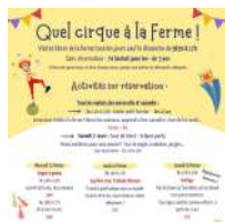
© La Ferme de la Marinette