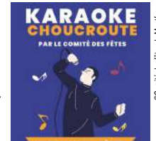
© Comité des Fêtes de Montfermy